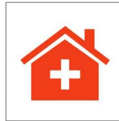
Zu Hause bleiben, wenn man sich krank fühlt