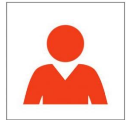
Fragen? Dann kontaktiere uns