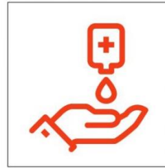
Desinfiziert eure Hände vor und nach dem Spiel