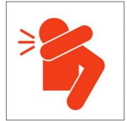
Hustet in den Ellenbogen