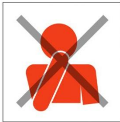
Vermeidet es, euch mit der Hand ins Gesicht zu fassen