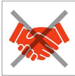
Verzichtet auf Hände schütteln