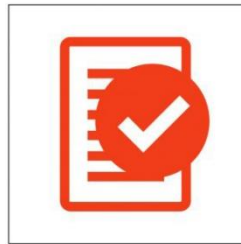
Haltet euch an unsere Vorgaben und Aushänge!